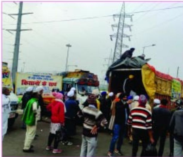
ਸੇਵਾਦਾਰ ਗਾਜੀਪੁਰ ਬਾਰਡਰ ਵਿਖੇ ਰਾਸ਼ਨ ਵੰਡਦੇ ਹੋਏ