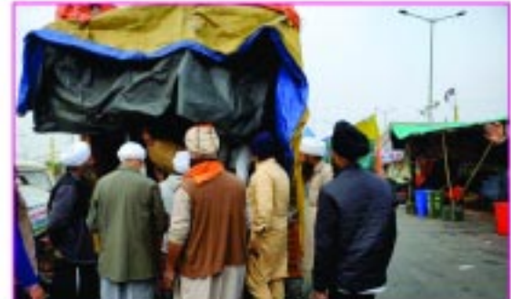
ਸੇਵਾਦਾਰ ਰਾਸ਼ਨ ਵੰਡਦੇ ਹੋਏ