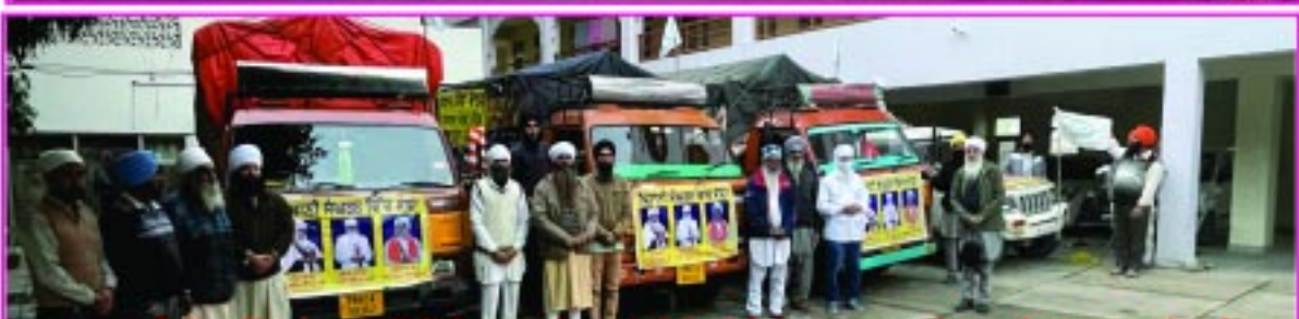
ਉਪਰੋਕਤ ਤਿੰਨ ਸਾਥੀਆਂ ਵਲੋਂ ਦਿੱਲੀ ਬਾਰਡਰਾਂ ਤੋਂ ਰਾਸ਼ਨ ਅਤੇ ਹੋਰ ਲੋੜੀਂਦੀਆਂ 60 ਵਸਤੂਆਂ ਦੇ ਨਾਲ ਭਰੇ ਟਰੱਕ ਰਵਾਨਾ ਹੋਣ ਸਮੇਂ