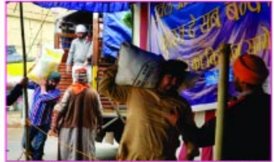
ਸੇਵਾਦਾਰ ਲੰਗਰਾਂ ਵਿਚ ਰਾਸ਼ਨ ਵੰਡਦੇ ਹੋਏ