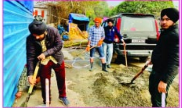
ਨੌਜਵਾਨ ਸੇਵਾਦਾਰ ਟੀਨ ਦੇ ਸ਼ੌਡ ਦੀ ਮੁਕੰਮਲ ਤਿਆਰੀ ਕਰਦੇ ਹੋਏ